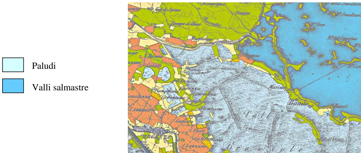
Fig. 4 – Esempio di interpretazione dell'Ambiente umido

stesso simbolo dell'acqua di mare sono state classificate come "valli salmastre", mentre quelle con il simbolo di palude e canneto, situate sia in aree costiere sia all'interno, non sono state connotate rispetto alla salinità dell'acqua, ma definite genericamente "paludi".